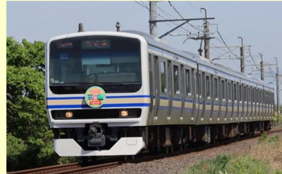
E231系成田線開業120周年ラッピング 2022年1月発売予定