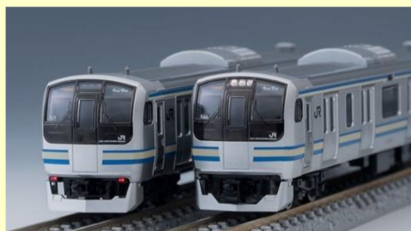
E217系(4次車・更新車) 好評発売中