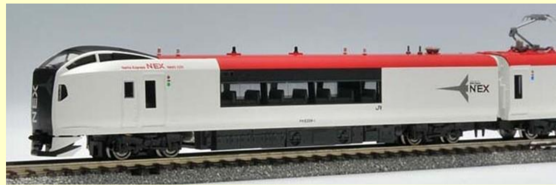
※写真は旧製品です 実際の製品仕様と異なる場合があります