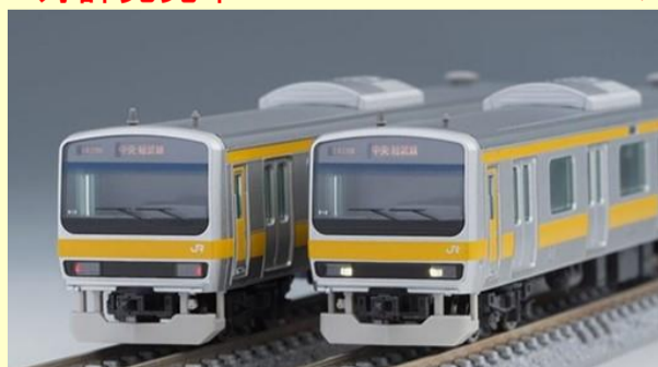
E231系(中央・総武線 各駅停車) 好評発売中