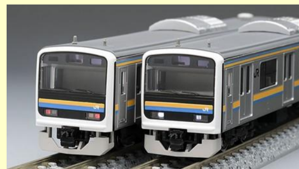
209-2100系(房総色) 2022年2月発売予定