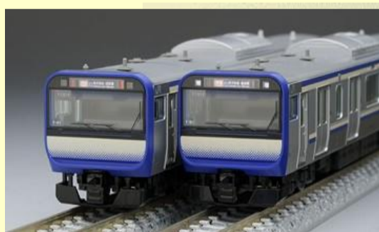
E235系電車(横須賀・総武快速線) 好評発売中