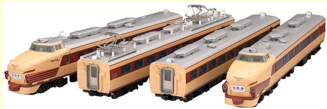
※写真はクロ481-100形が入った旧製品で実際の製品仕様と異なる場合があります