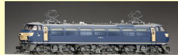
EF66形(JR貨物新更新車) 好評発売中