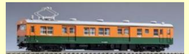
国鉄クモニ83-0形湘南色