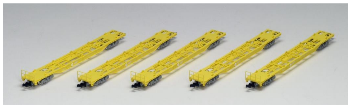
<98234> コキ110形 (コンテナなし) セット