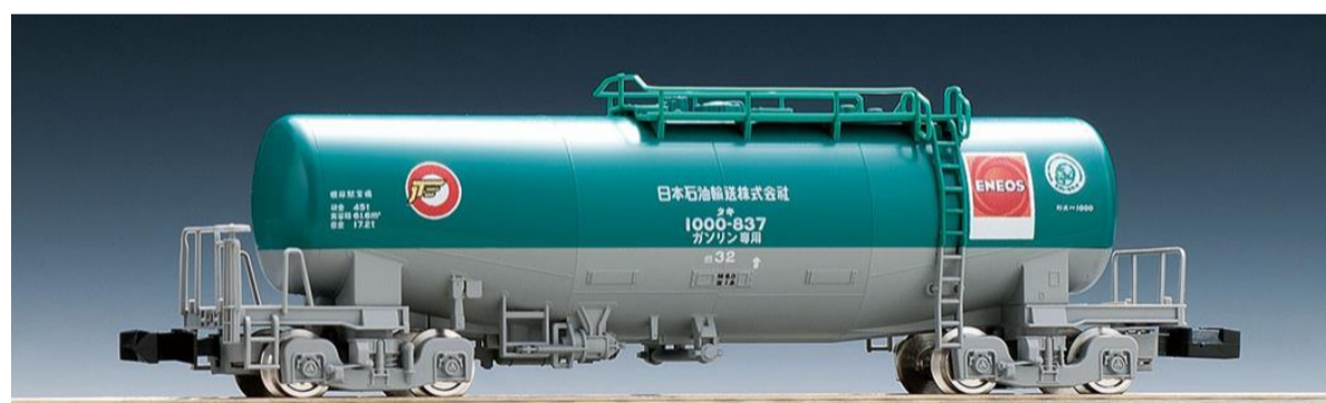
<8713> タキ1000形 (日本石油輸送・ENEOS)