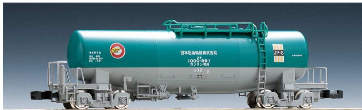
<8712> タキ1000形 (日本石油輸送・米タン)