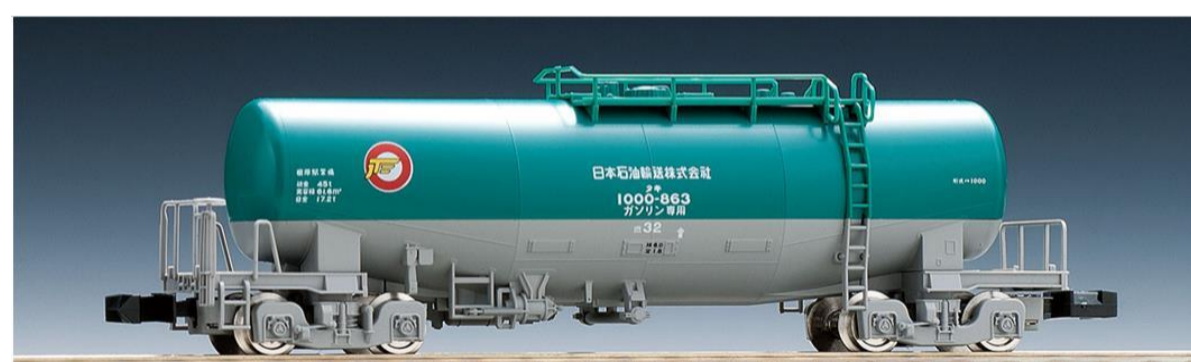
<8711> タキ1000形 (日本石油輸送)