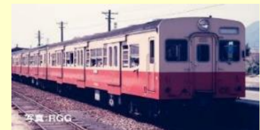
キハ35系ディーゼルカー各種 10月発売予定