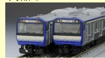
E235系 横須賀・総武快速線 好評発売中