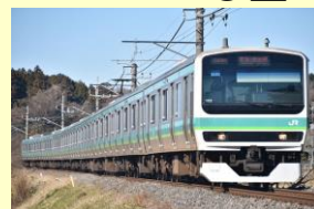
E231系 常磐・成田線 10月発売予定