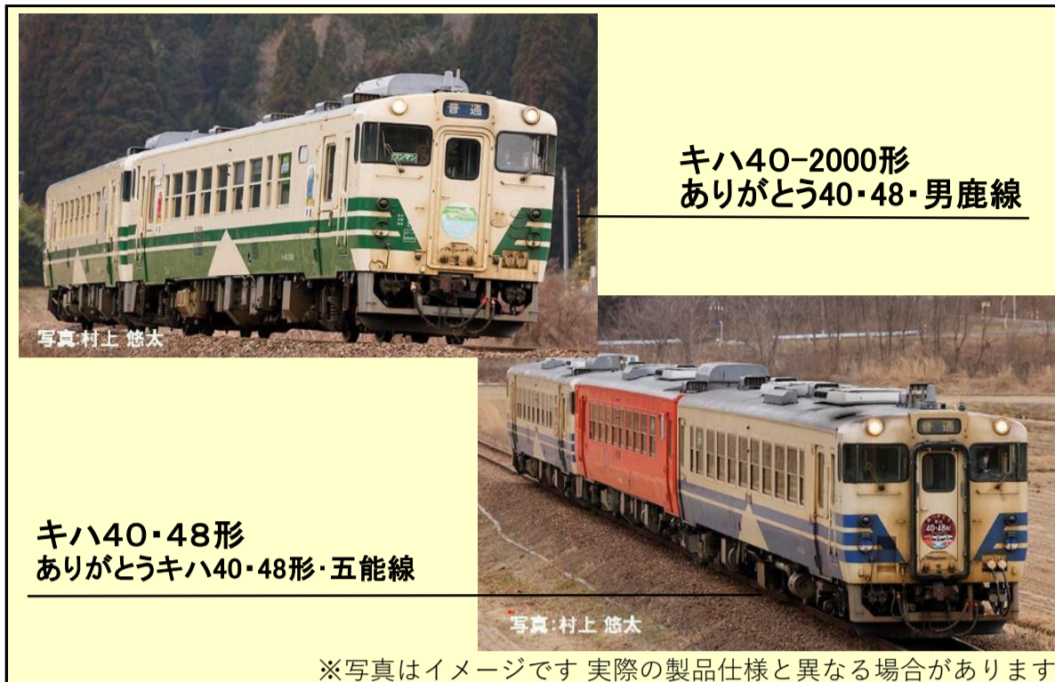
キハ40-2000形 ありがとう40・48・男鹿線