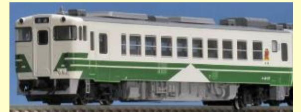
キハ40系男鹿線・五能線 好評発売中