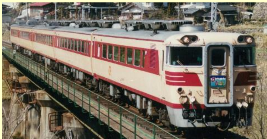
※写真はイメージです 実際の製品仕様と異なる場合があります