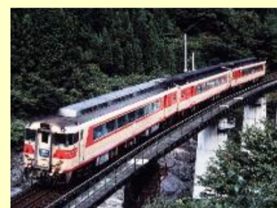
名鉄8200系 12月発売予定