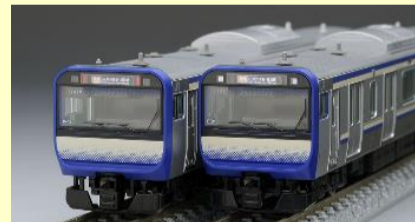
E235系 横須賀・総武快速線