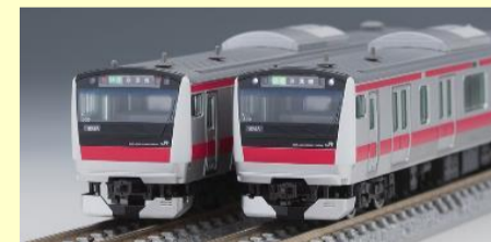
E233系 京葉線 好評発売中