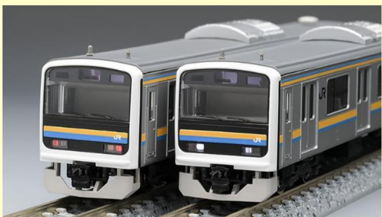
※写真は旧製品です 実際の製品仕様と異なる場合があります