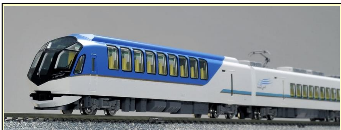
※写真は旧製品です 実際の製品仕様と異なる場合があります