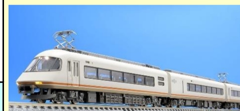
近鉄21000系 アーバンライナー 好評発売中

＜別売りオプション＞ 室内灯:<0733>LC白色 TNカプラー:<0336>密連形