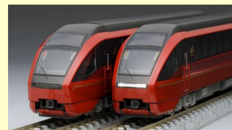
近鉄80000系 ひのとり 好評発売中

＜別売りオプション＞ 室内灯:<0733>LC白色 室内灯:<0734>LC電球色 TNカプラー:<0336>密連形