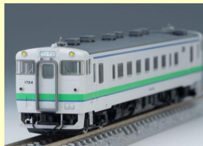
キハ40-1700形タイフォン撤去車 好評発売中