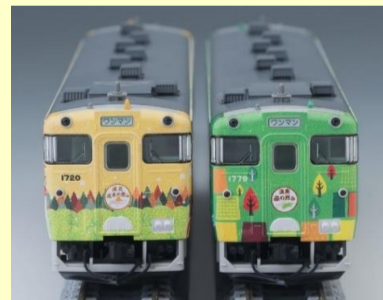
道北 流水の恵み・道東 森の恵み 好評発売中