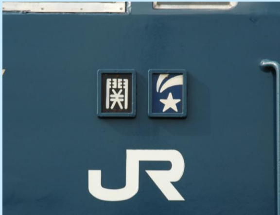
※写真はイメージです 実際の製品仕様と異なる場合があります

区名札の「関」「流れ星」は <HO-2022・2023>はシール付属 <HO-2517・2518>は印刷済み