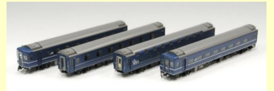
14系15形富士・はやぶさ 9月発売予定