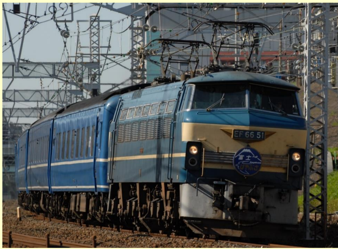
※写真はイメージです 実際の製品仕様と異なる場合があります