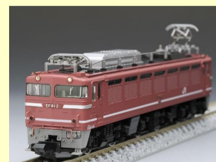
EF81形 各種 好評発売中