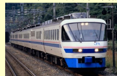
485系 スーパー雷鳥 9月発売予定