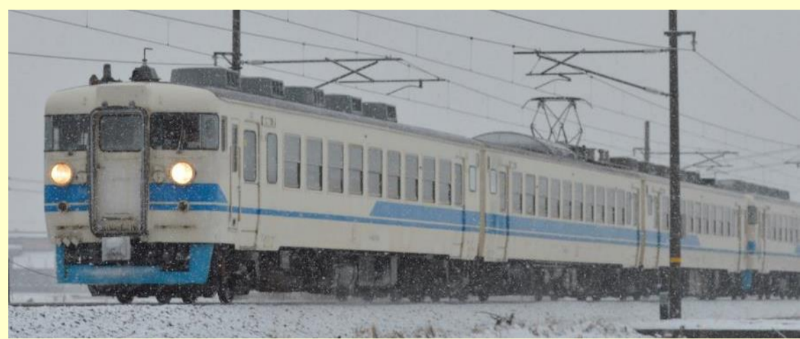
※写真はイメージです 実際の製品仕様と異なる場合があります