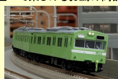
103系 JR西日本仕様・ウグイス 5月発売予定