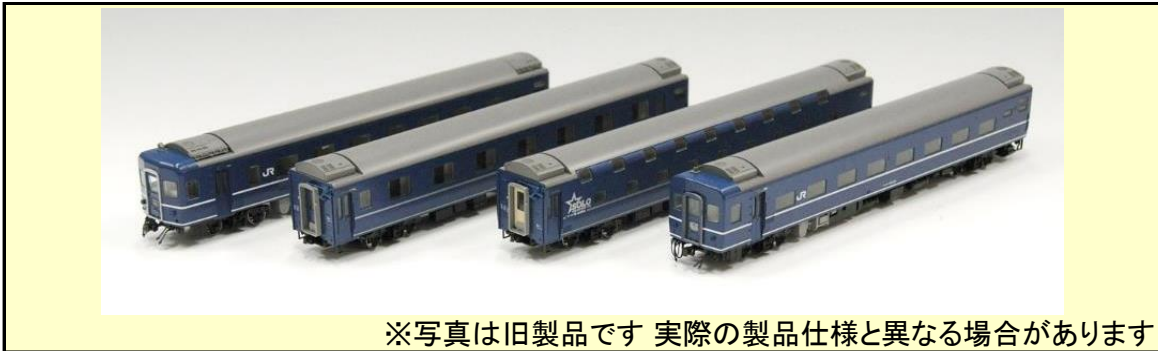
※写真は旧製品です 実際の製品仕様と異なる場合があります