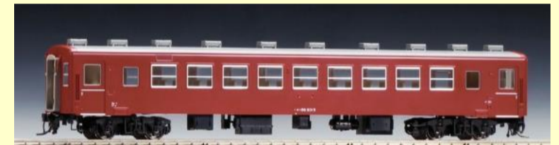
オハフ50形・オハ50形