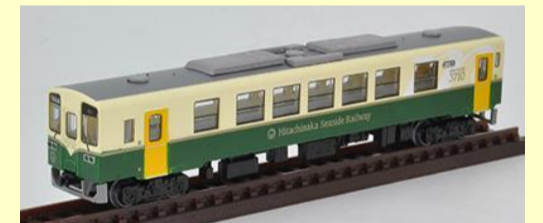
鉄コレ ひたちなか海浜鉄道キハ3710形 好評発売中