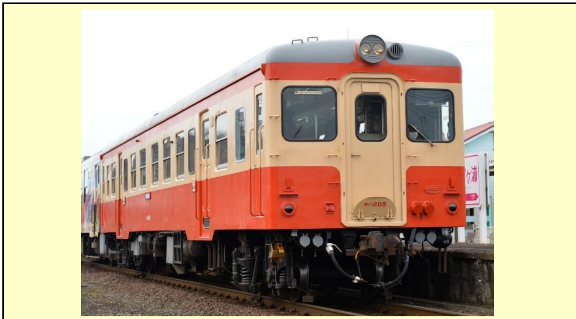
※写真はイメージです 実際の製品仕様と異なる場合があります