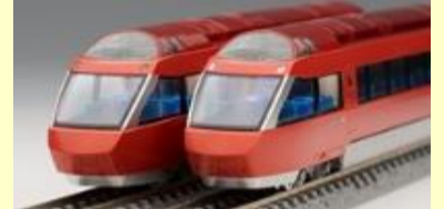
小田急ロマンスカー70000形GSE(第2編成) 7月発売予定