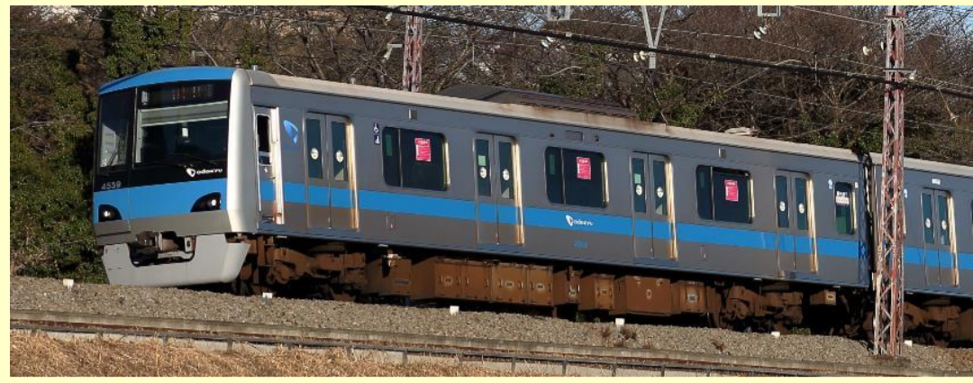
※写真はイメージです 実際の製品仕様と異なる場合があります