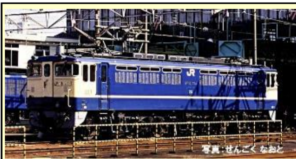
前期型・田端運転所