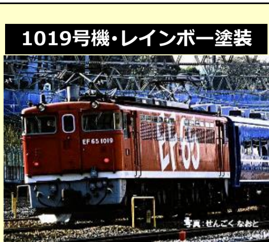
1019号機・レインボー塗装