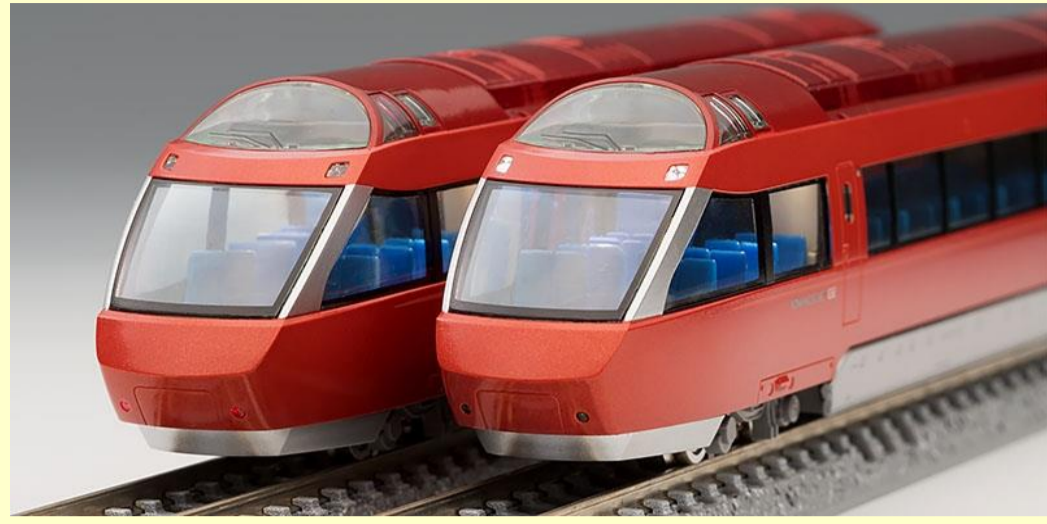
※写真は旧製品です 実際の製品仕様と異なる場合があります