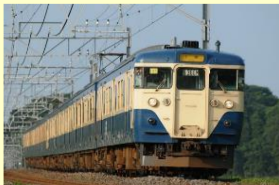
特別企画品 1132000系近郊電車 (横須賀色・幕張車両センター114編成) 2月発売予定