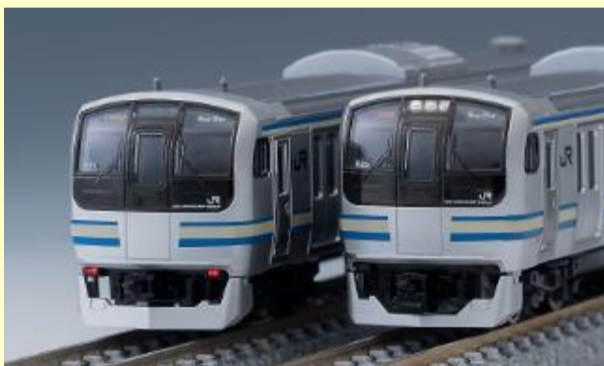
E217系近郊電車(4次車・更新車) 好評発売中