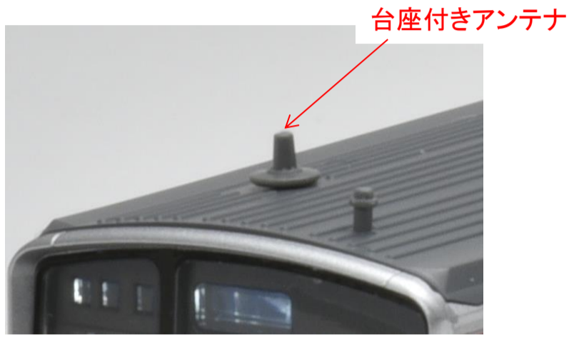
台座付きアンテナ