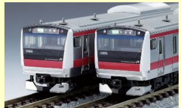
E2335000系電車(京葉線) 2月発売予定