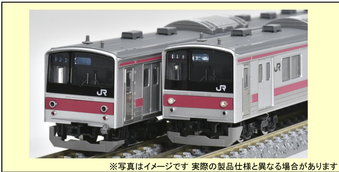
※写真はイメージです 実際の製品仕様と異なる場合があります