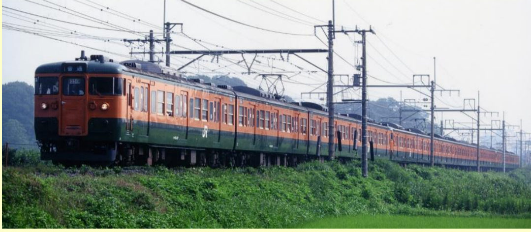
※写真はイメージです 実際の製品仕様と異なる場合があります