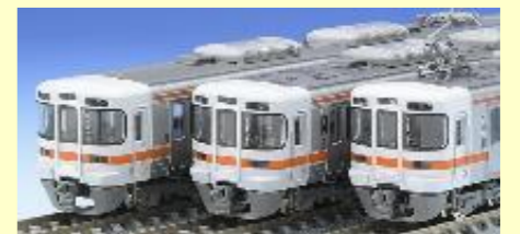
313系各種 好評発売中