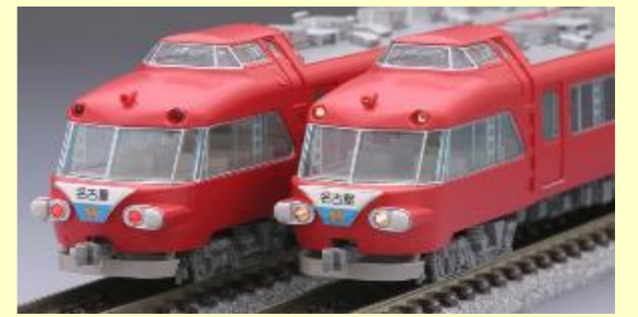
名鉄パノラマカー各種 好評発売中