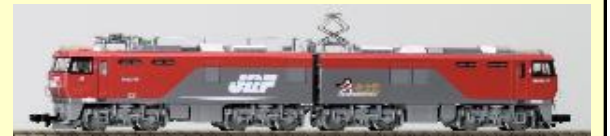
EH500形(3次車・GPS付後期型)