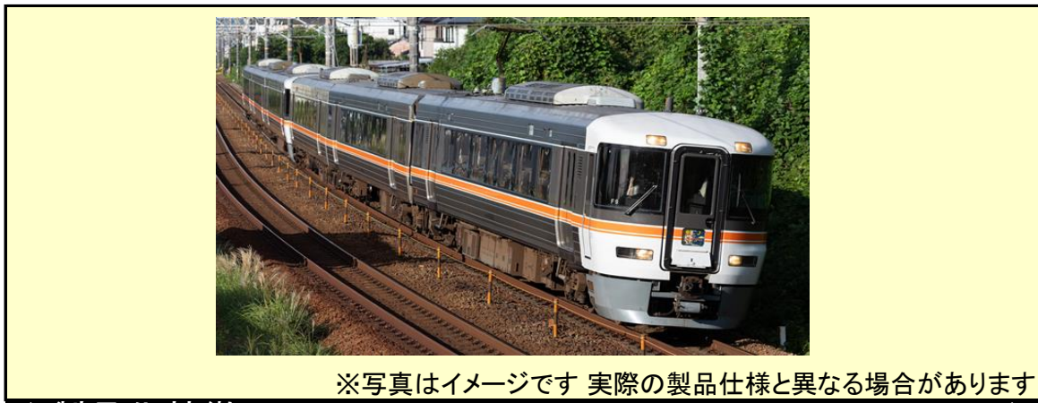
※写真はイメージです 実際の製品仕様と異なる場合があります