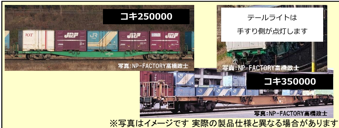
※写真はイメージです 実際の製品仕様と異なる場合があります