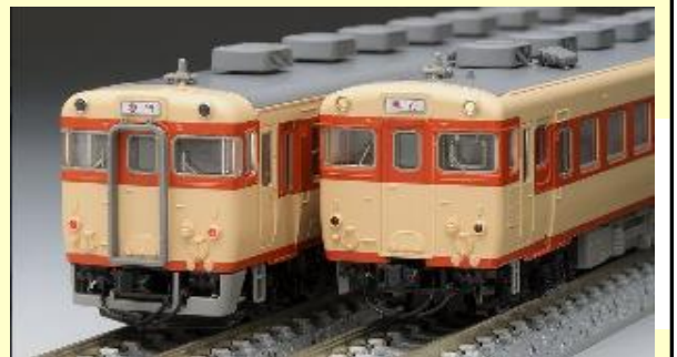
キハ58系急行色各種