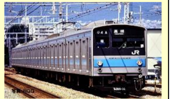
205系(京阪神緩行線) 2月発売予定