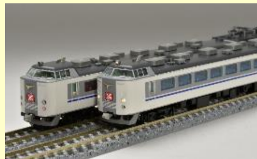
485系(はくたか) 1月発売予定