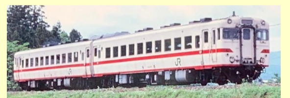
キハ58系陸中・盛岡色