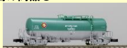
タキ1000形(日本石油輸送) 好評発売中