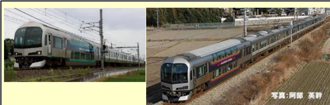
※写真はイメージです 実際の製品仕様と異なる場合があります