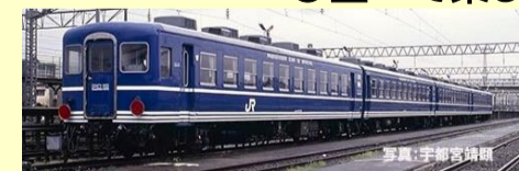
12系客車(シュプール大山号用) 1月発売予定