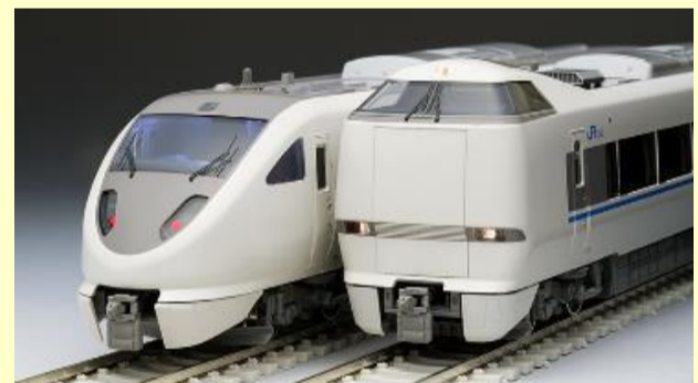
683系 サンダーバード