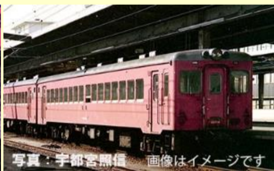
画像はイメージです