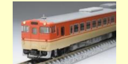
キハ40系更新車(姫新線)