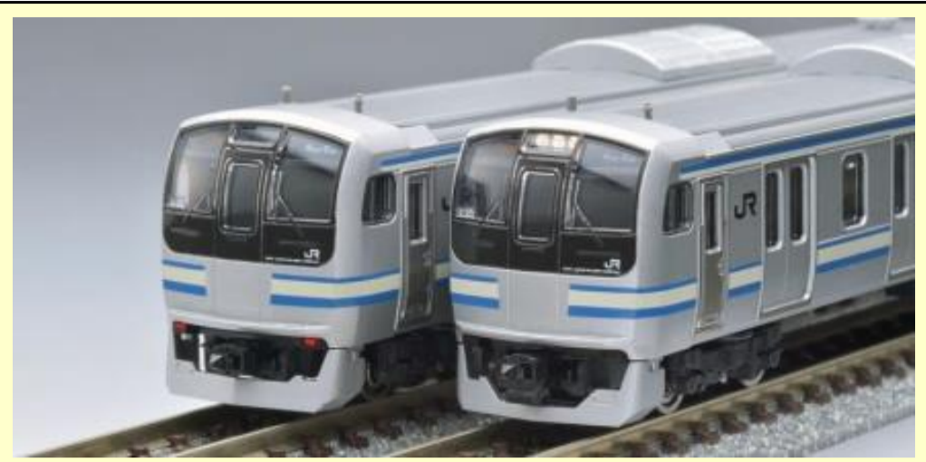
※写真は旧製品です 実際の製品仕様と異なる場合があります