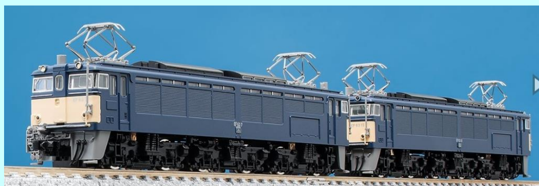
<98031> JR EF63形電気機関車(1次形・2次形・青色)セット