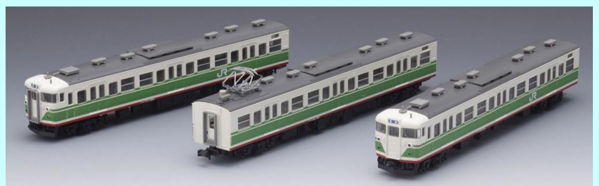
<92389> JR 115 1000系近郊電車(信州色)セット