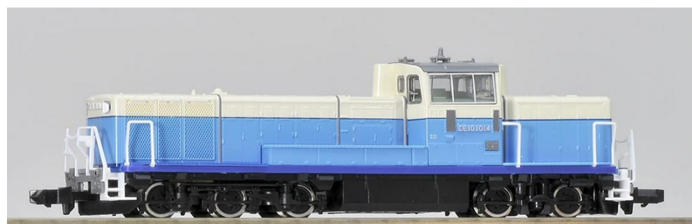
<2237> JR DE10-1000形ディーゼル機関車 (アイランドエクスプレス四国)