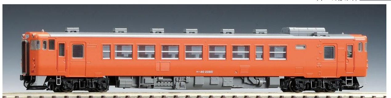
<8405> 国鉄ディーゼルカー キハ40-2000形(M) <8406> 国鉄ディーゼルカー キハ40-2000形(T)

JR東日本商品化許諾済 JR東海承認済 JR西日本商品化許諾済 JR四国承認済 JR九州承認済