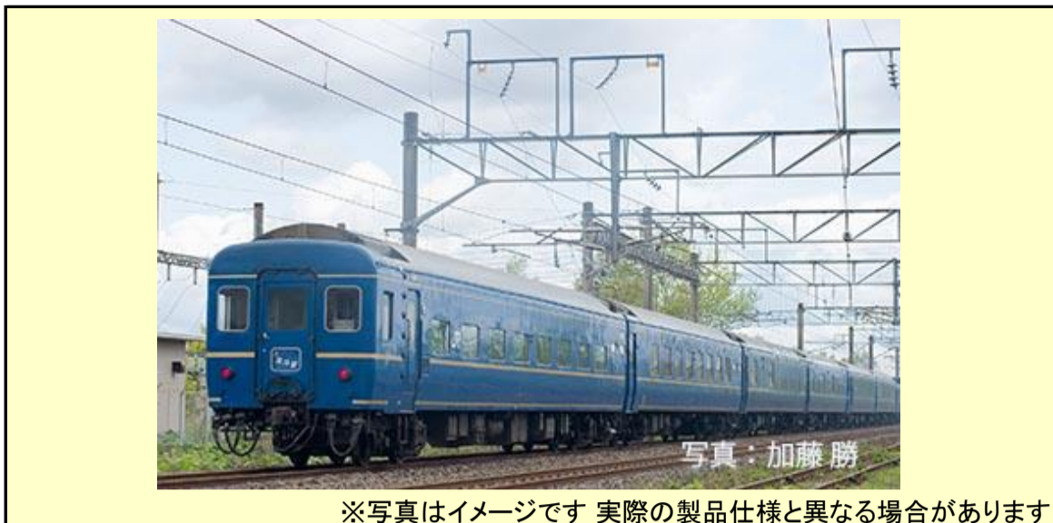
※写真はイメージです 実際の製品仕様と異なる場合があります