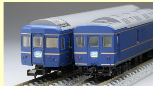
24系特急寝台客車(エルム)