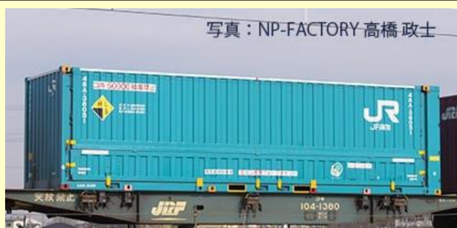
48A-38000形コンテナ(新塗装)