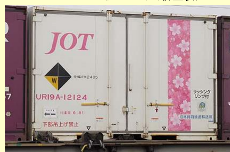
UR19A-12000形コンテナ(日本石油輸送・桜帯)