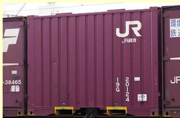
19G形コンテナ(新塗装)