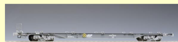
コキ106形 (グレー・コンテナなし ・テールライト付)