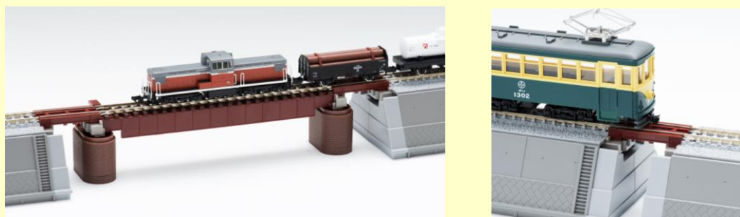
形状の異なる鉄橋との組み合わせも！