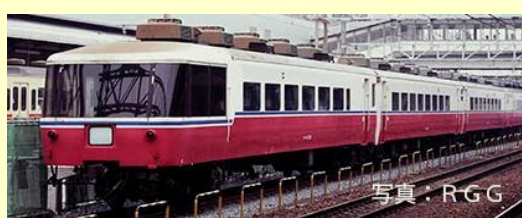
14系客車(リゾート白馬)