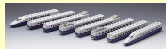
E2-0系 長野新幹線 あさま 好評発売中