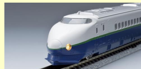
200系 リニューアル車 好評発売中