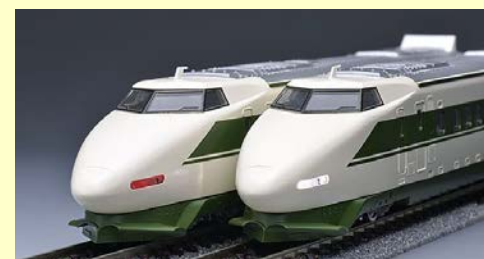
200系 東北新幹線 H編成 好評発売中