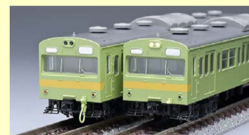
103系新製冷房車・関西線