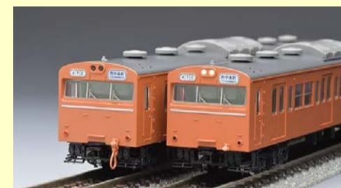
103系高運転台オレンジ