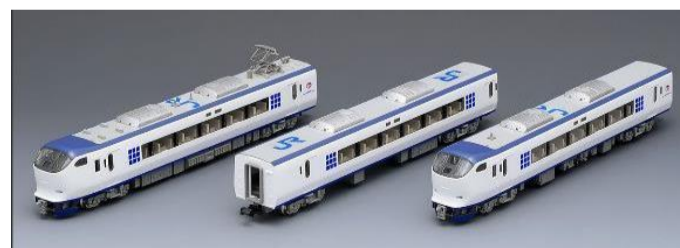
JR 281系特急電車(はるか)増結セット