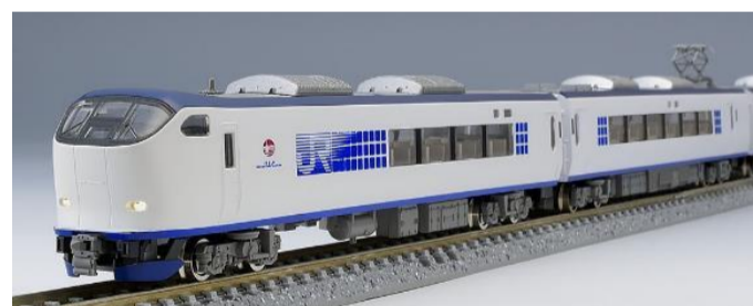
JR 281系特急電車(はるか)基本セット