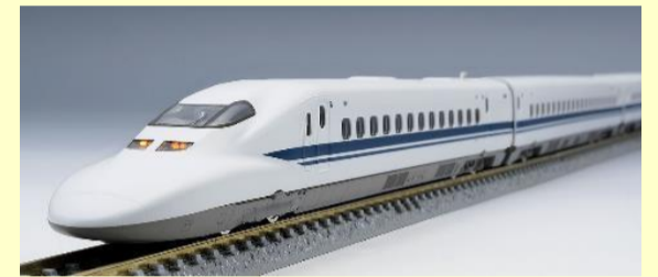
700-0系東海道・山陽新幹線