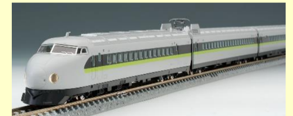
0-7000系山陽新幹線 (フレッシュグリーン)