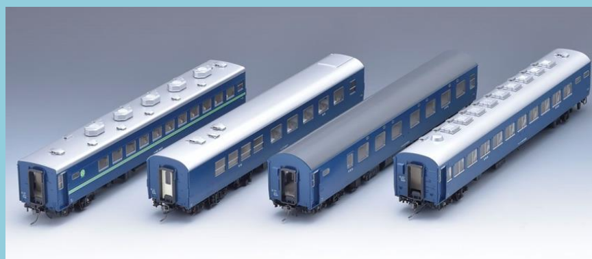
■<HO-9046>10系客車(夜行急行列車)セット