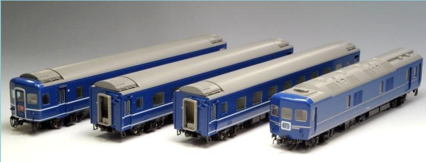
■<HO-9043>国鉄 24系24形特急寝台客車セット