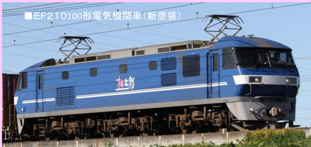
■EF210100形電気機関車(新塗装)