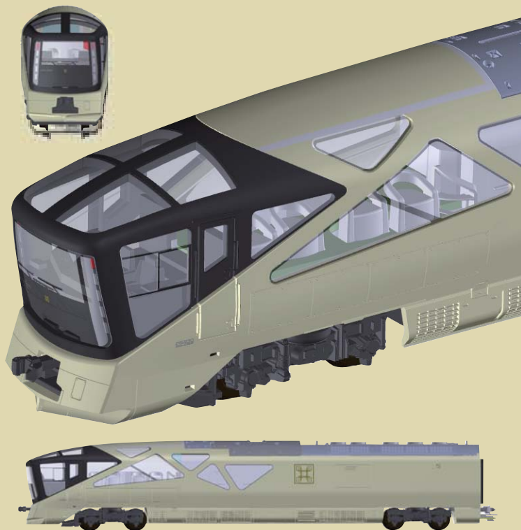
先頭車 E001-1 側面図

客室内のテーブルは、写真などではレンズの広角で楕円に見えるが、取材をもとに、より実車に近い円形で再現。