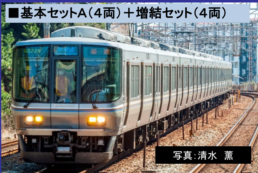
■基本セットA(4両)+増結セット(4両)