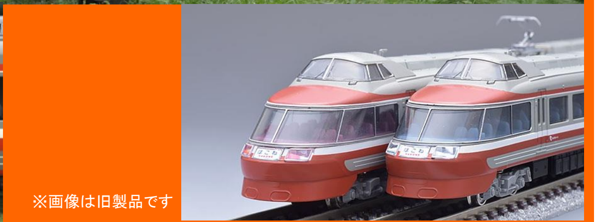
※画像は旧製品です