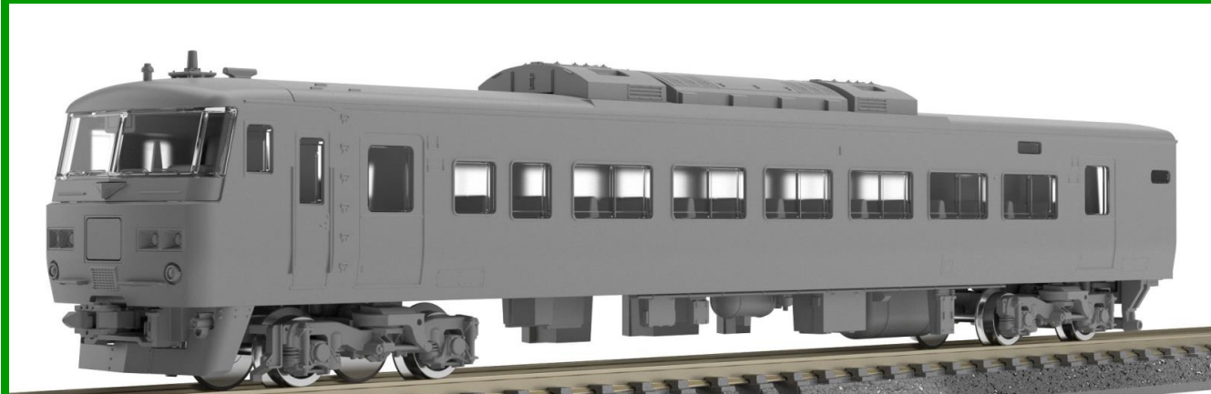
※画像は開発中の設計データを使用したCGです