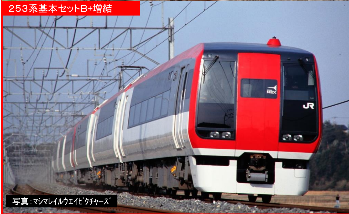
写真: マシマレイルウエイ化「クチャース」